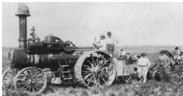
Primera máquina aradora que funcionó en el país (1901) (Del libro Origen y Desarrollo de La Segunda, 75 Aniversario)

"En el año 1960 las fábricas argentinas de máquinas agrícolas exponen en una feria industrial de Italia cosechadoras y cabezales maiceros. Diez años más tarde, la industria argentina del sector intenta acuerdos integracionistas en la región, vendiendo tecnología al exterior e incluso radicando empresas en otros países como es el caso de Vassalli que se instaló por aquellos años en Brasil..." (1)